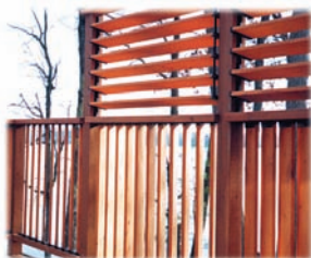
Panneaux coupe-vent et d'intimité

Une simple trousse de quincaillerie offrant une infinité de conceptions et de solutions fonctionnelles!