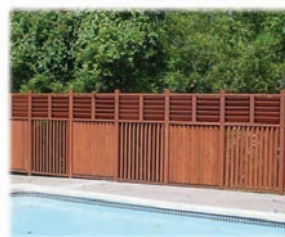
Superbes clôtures et rampes