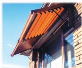
Auvents faciles à ouvrir et à fermer