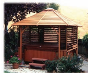
Abri pour spa